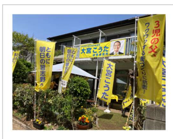
多くのボランティアの方に支えていただいた選挙でした

選挙後、市議会における会派について検討しました。選挙結果、そして、自分の信念を踏まえて熟慮した結果、新しい会派「明日の習志野」を一人で立ち上げました。一人会派ですので様々な困難があると思いますが、選挙で私に寄せいただいたご期待に応える最良の選択と考えています。選挙も一人で始めて、地道な活動を通じて仲間を増やしてまいりました。政治活動についても、一人会派から始めて、信念を大事に、ブレずに、着実に活動して、仲間を増やし、そして、成果を出していけるように頑張ります。