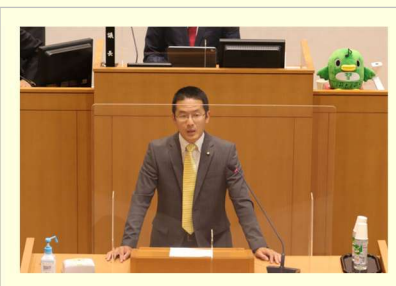
初の一般質問、想いと熱を込めて、なるべく原稿を読まずに臨みました。

習志野市は「やさしさでみんながつながるまち」を将来都市像としています。一方、 人口規模・割合、産業構造等の具体的な将来像は明確ではなく 、また、将来像から今を捉えて街づくりをする「バックカスティング」が重要という観点で、街づくりの基本的な方向性について質問しました。市長から「生産年齢人口や年少人口を呼び込み、魅力のあるバランスの取れた都市空間の形成を目指す」という旨の回答がありました。この回答に対し、 市として目指す人口規模・割合等の具体的な将来像を設定してバックカスティングで街づくりを行っていくこと、人口推計の基準を明確化していくことを要望 しました。また、 魅力ある街づくりのために公有地を安易に売却するのではなく 、旧・庁舎跡地についても市民にとって一番よい活用のあり方を検討するように要望しました。