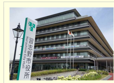
習志野市議会議場は市庁舎6階にあります。