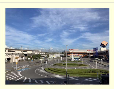
可能性が溢れている新習志野駅周辺。スポーツ、海、公園、にぎわいのある街を目指していきます。

京葉線南北の地域（秋津、香澄、茜浜、芝園）を一体的に捉えた 将来構想 を練り、ワクワクする街づくりを行っていくことを要望した結果、市長から「 前向きな提案は有難い。ワクワクするような形にすべく頑張っていく。 」という前向きな考えをいただきました。新習志野駅周辺は街づくりの潜在性が高く、 ワクワクする街を創ることができると確信 しています。引き続き、全力で取り組みます。